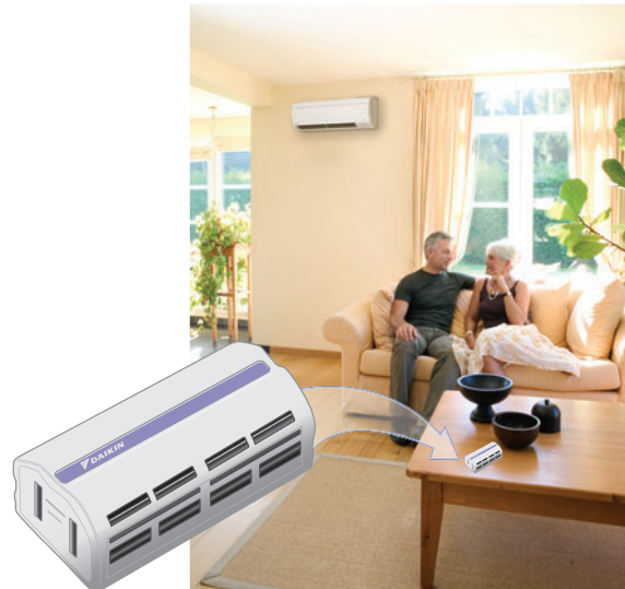
Деодорирующий каталитический картридж